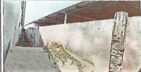
Foto 4: Reparación de muro perimetral debido a que se encuentra en muy mal estado.