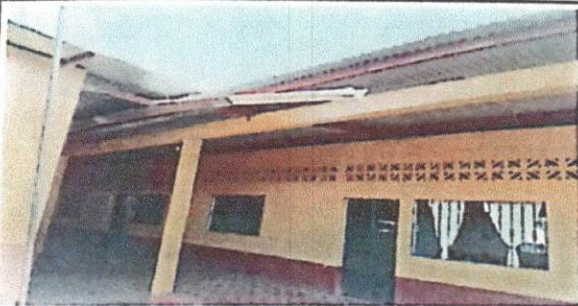
Foto 5: Sustitución de canal de metal debido que esta en mal estado y hay partes que no tiene y el agua pluvial cae en los corredores.