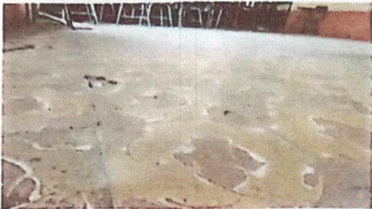
Foto 1: Sustitución de piso cerámico debido a que se encuentra en mal estado.