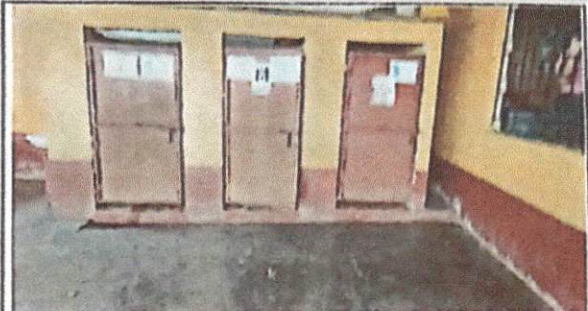
Foto 2: Mantenimiento de puertas y remplazo de chapas, del Establecimiento.